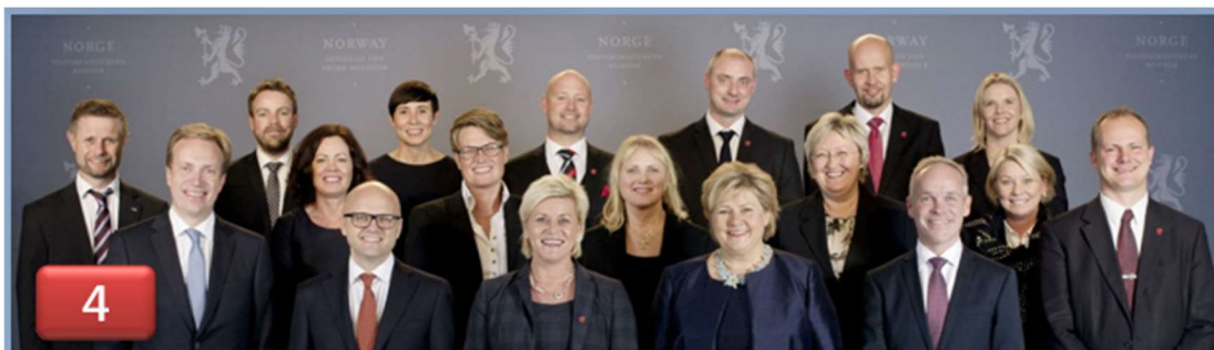
2013 regjeringen Erna Solberg.