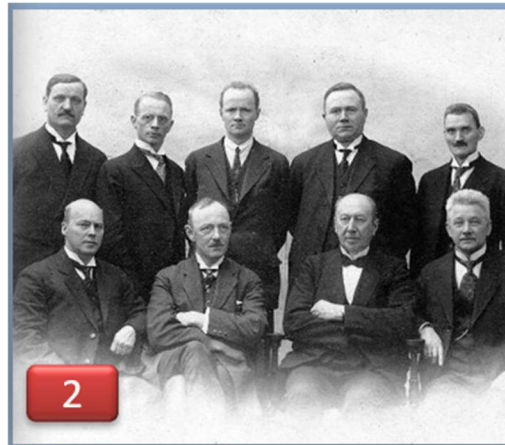
1928 regjeringen Hornsrud.