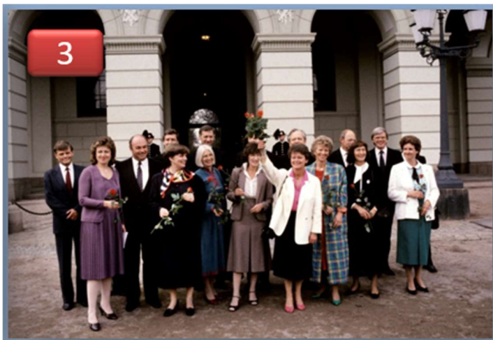
1986 regjeringen Gro Harlem Brundtland.