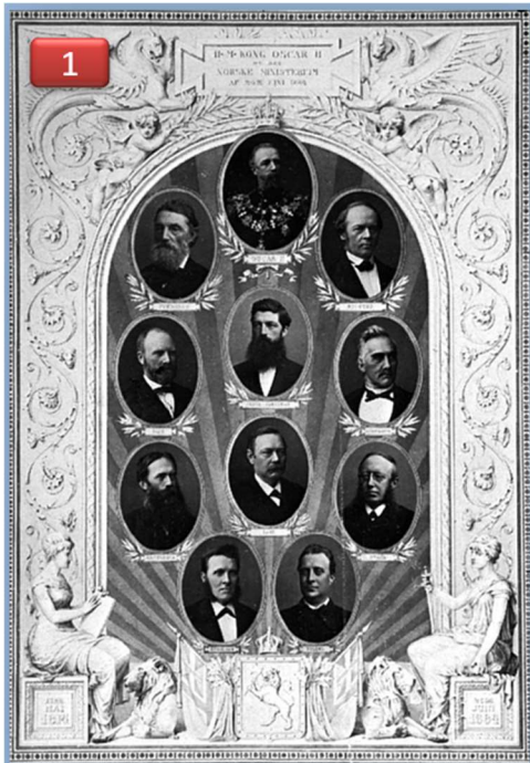
1884 regjeringen Johan Sverdrup.